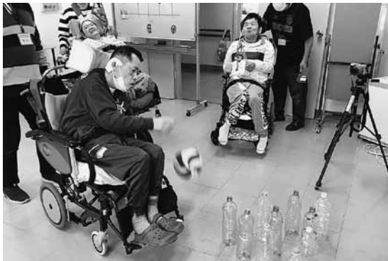
スポーツレクリエーション